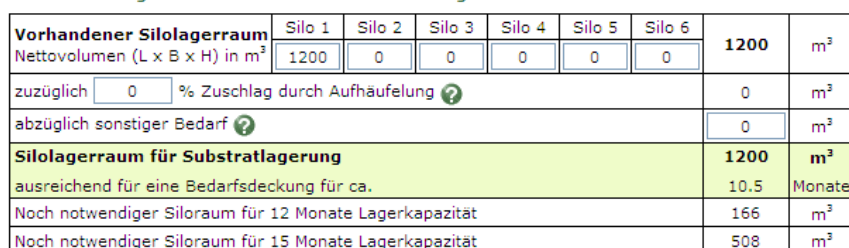
Tabelle 2: Abgleich mit dem vorhandenen Silolagerraum

In Tabelle 2 werden oben die vorhandenen Silagelagerkapazitäten als Nettovolumen eingetragen. Eine entsprechende Überfüllung wird als Zuschlag (Zeile 2) berücksichtigt. Grundsätzlich sollte das Netto-Volumen (Überfüllung 0 %) ausreichend sein. In der Praxis wird aber i. d. R. eine Überfüllung durchgeführt. Dies ist nur in begrenztem Maß möglich! In Abhängigkeit der Silowandhöhe und Silobreite kann die Überfüllung realistisch abgeschätzt werden (abgeschrägte Flanken beachten!). Anzumerken ist hier, dass sich ggf. das spezifische Gewicht (Lagerdichte) mit zunehmender Stapelhöhe steigern kann und somit der Lagerraumbedarf sinkt. Ein entsprechender Hinweis bei Aufruf des Fragezeichens deutet auf die Einhaltung der Unfallverhütungsvorschrift (Vergleich Unfallverhütungsvorschriften Lagerstätten VSG 2.2) sowie die Beachtung der Statik hin.