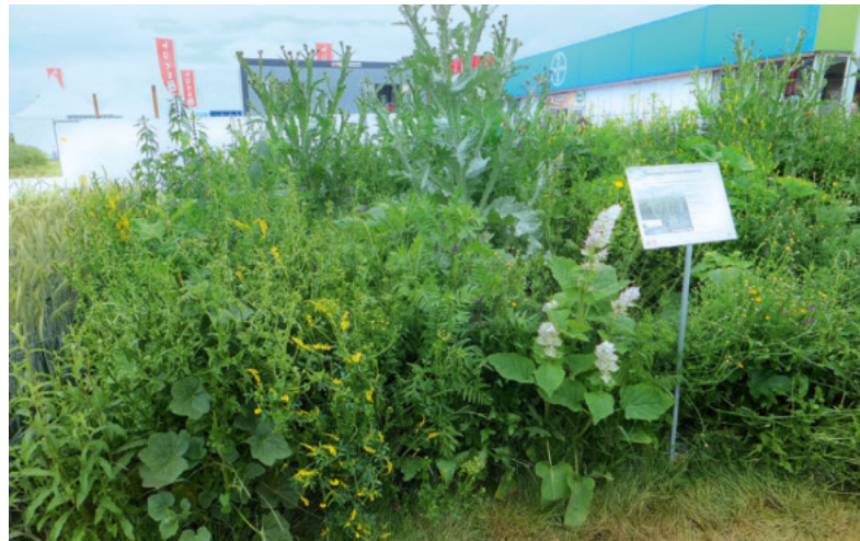
Wildpflanzen in der Kulturlandschaft: Der Veitshöchheimer Hanfmix (hier bei den DLG-Feldtagen 2016) hat sich mit langer Blühdauer auch in späteren Aufwuchsjahren bewährt.

Die verkürzte Standzeit von Getreide-GPS im Vergleich zu Körnergetreide bietet den Anbau von Zweit- oder Zwischenfrüchten an.