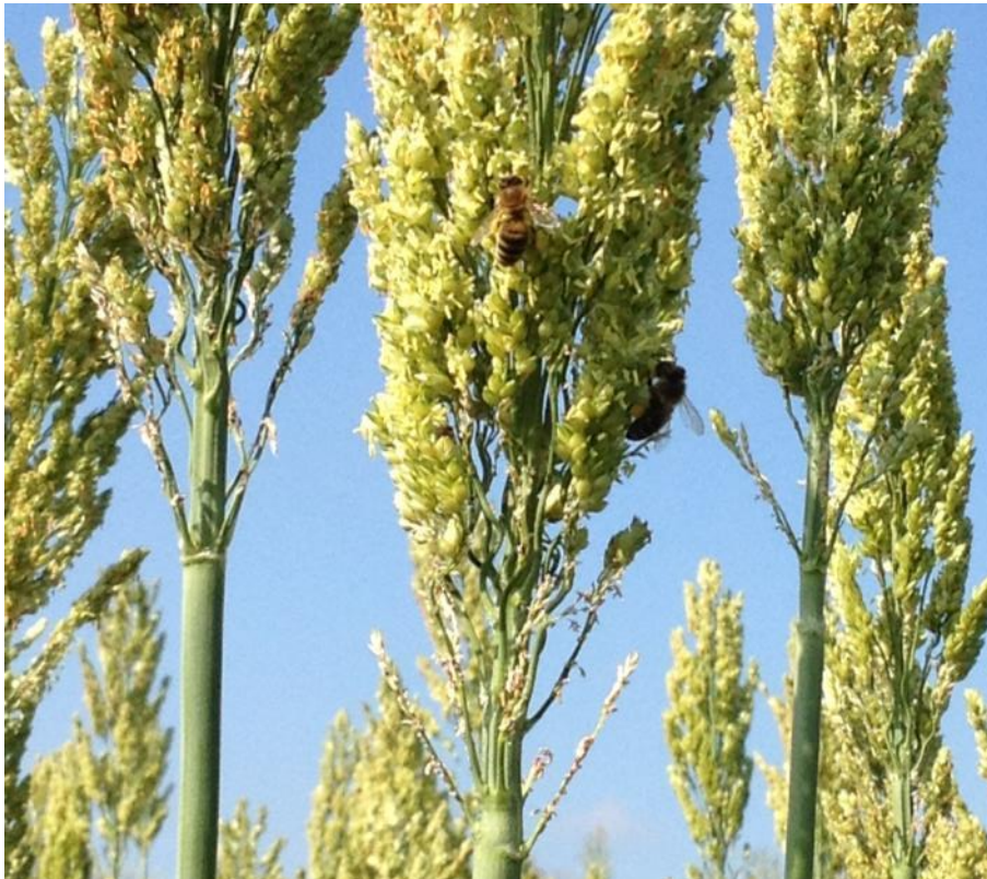
Abbildung 3: Pollensammelnde Bienen an blühendem Sorghum

Hinsichtlich ihrer Umweltwirkungen unterscheiden sich Sorghum und Mais vergleichsweise wenig. Positiv herauszuheben für Sorghum sind der meist engere Reihenabstand, das sehr späte und auch kräftig von Bienen nachgefragte Pollenangebot (siehe Abbildung 3) sowie die deutlich geringeren Ansprüche an die Stickstoffversorgung. Fragen zur Wasser- und Nährstoffeffizienz sowie zur Humusnachlieferung sind für Sorghum bislang noch nicht beantwortet. Im Vergleich zu Mais ist Sorghum für Wildschweine als Futterpflanze wenig attraktiv, trotzdem können bei hohem Tierbesatz Schäden in den Beständen entstehen.